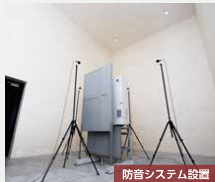
防音システム設置