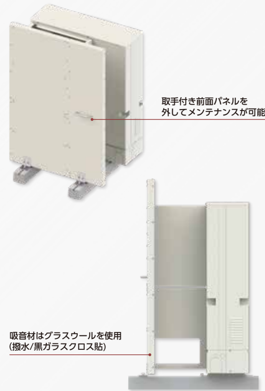
取手付き前面パネルを外してメンテナンスが可能

スライドブロック上の室外機に対して設置できる防音システムです。設置条件が限られるため、据付説明書や納入仕様図をご確認ください。