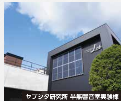
ヤブシタ研究所 半無響音室実験棟

記載の防音効果は半無響音室にて自社測定基準により測定した実測値です。実際の現場では室外機能力、設置環境、運転状況、暗騒音などにより効果が異なる可能性がありますので、ご注意のほどお願い致します。