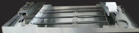
ヒーター組込仕様外觀

ドレンパンへの積雪やドレン配管の凍結を防ぐサーモスタッド付きヒーター組込仕様もラインナップしており、寒冷地区での設置も可能です。